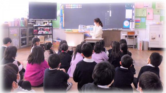
PTAおはなしサークルさんの読み聞かせ

地域の方をはじめ、たくさんの方が 教育活動に関わってくださっています。 ありがとうございます。