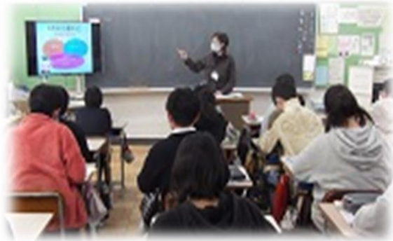
6年:学校薬剤師の方による薬物乱用防止教室