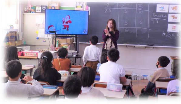
ALTさんのクリスマス・スペシャル授業